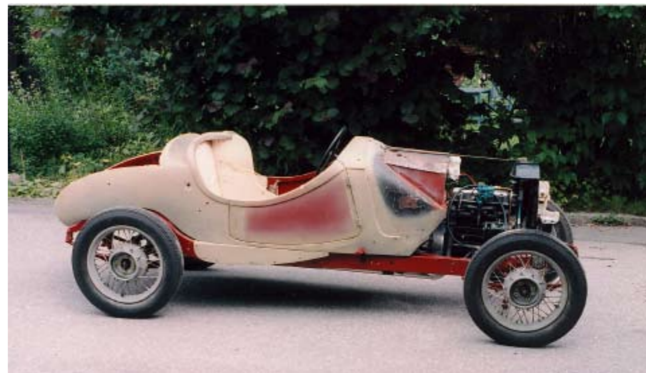
Korrekt motor och växellåda passas in...

Till 1934 hade motor och växellåda utvecklats med toppventiler, högre prestanda och fyra växlar. Motorerna benämning ändrades från 108S med sidventiler till 108CS med toppventiler. Det var i detta utförande som Guldpokalen erövrades.