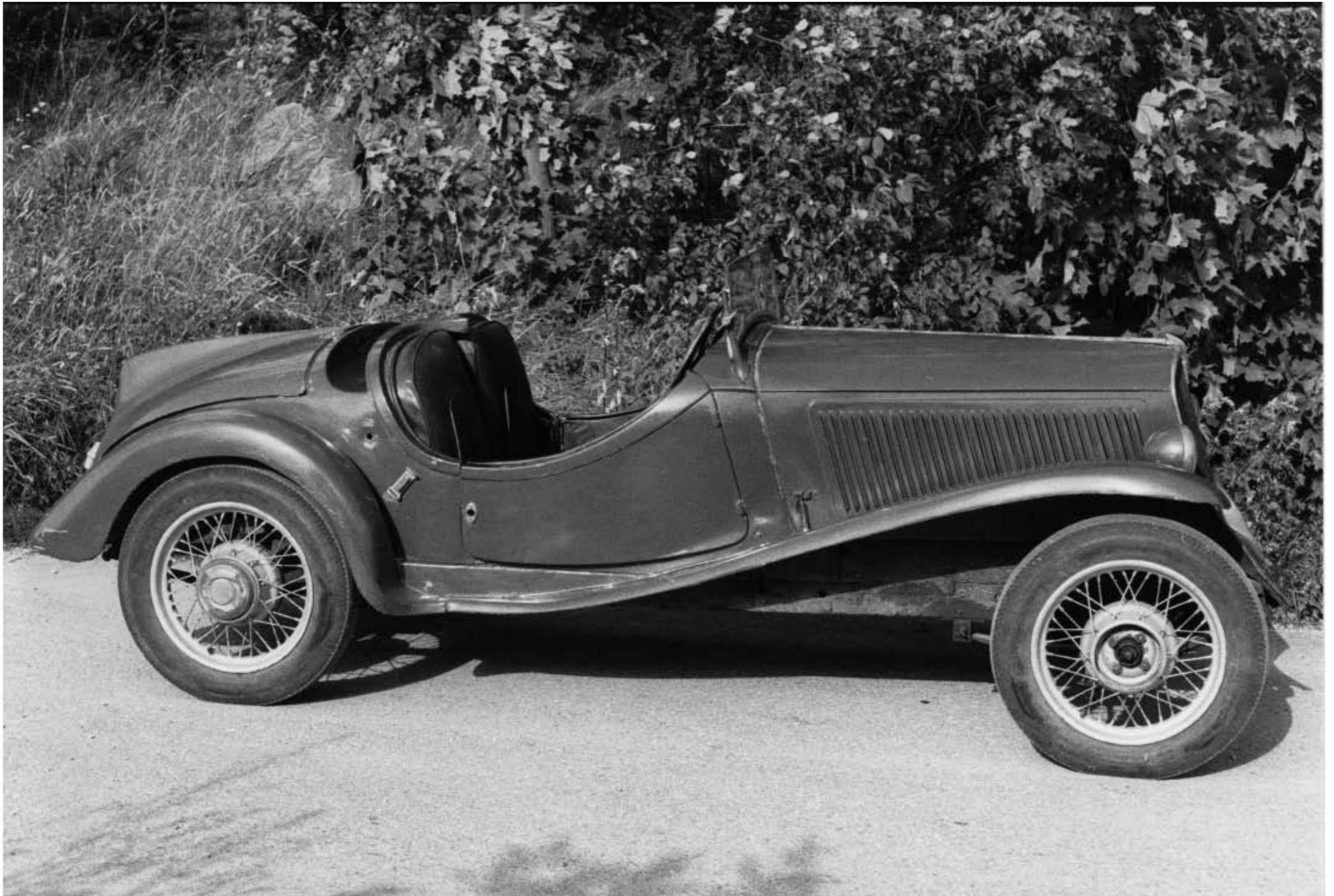
Fiat 508S Balilla Sport, före renoveringen (1983).