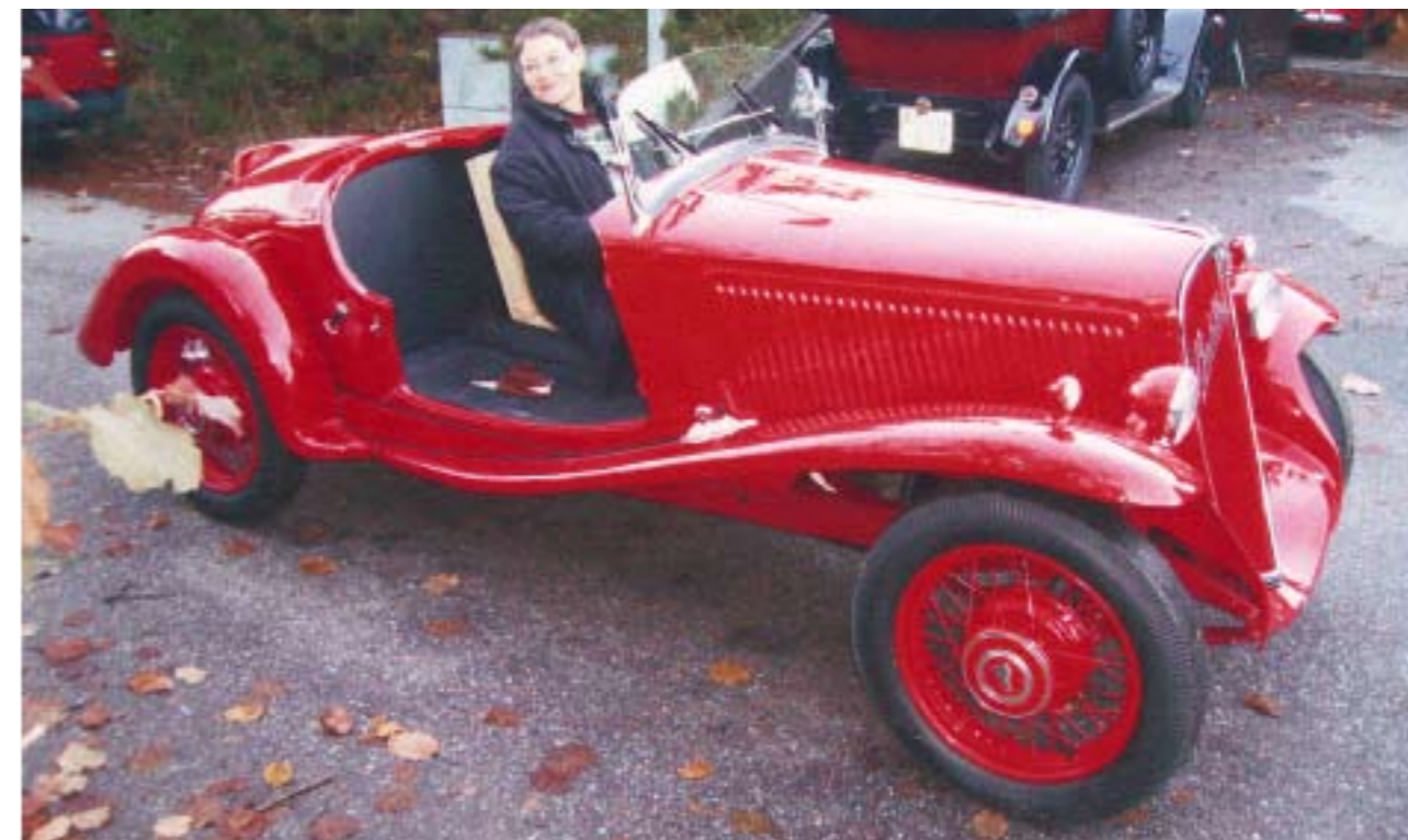
Provkörning, hösten 2008...