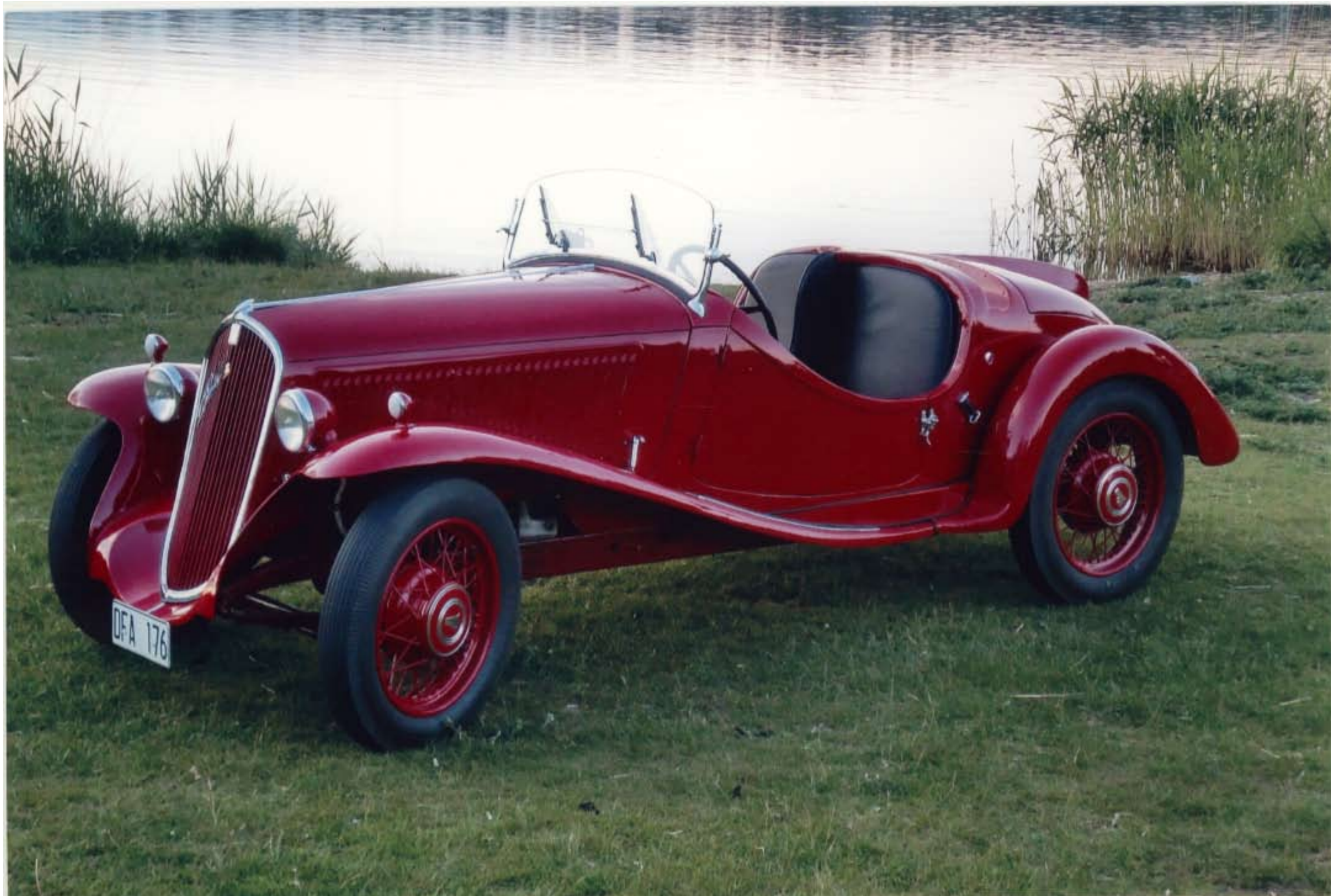
Äntligen klar, våren 2009...