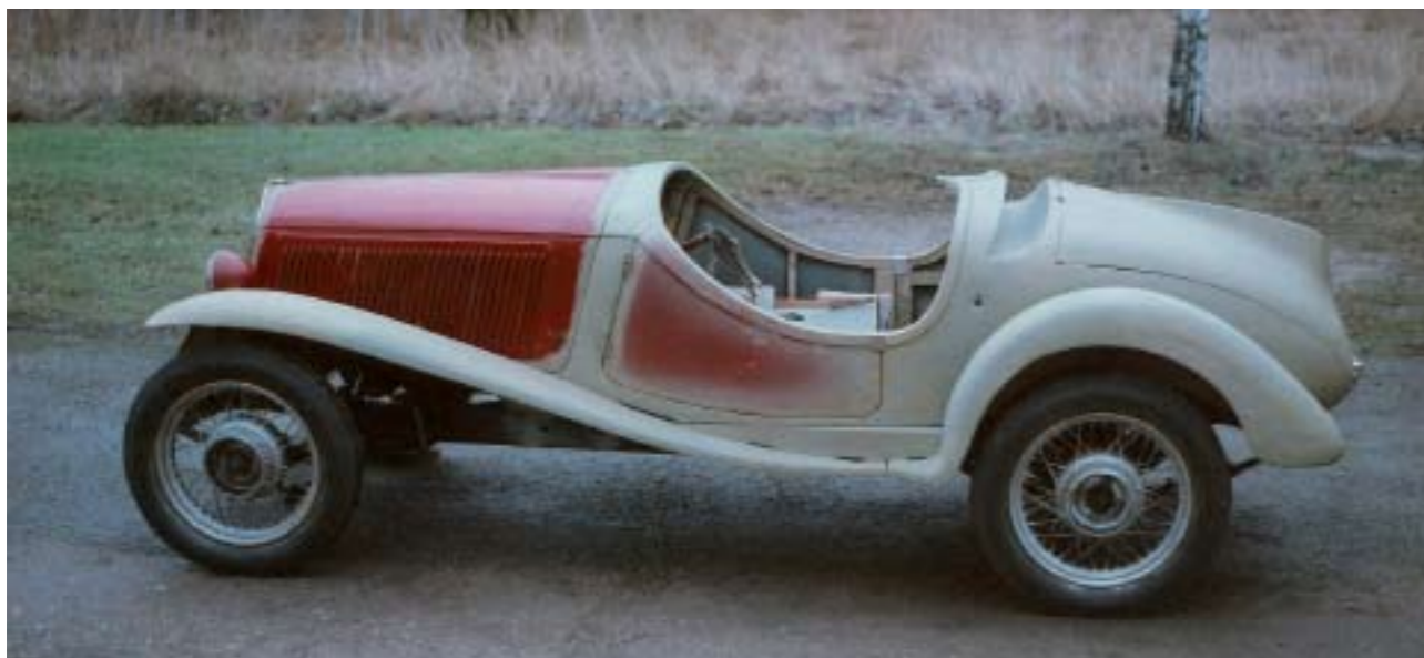
Karossen nästan klar...